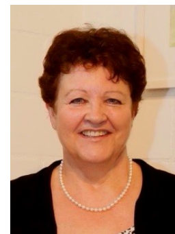
Doris Agassis Farbintensives Acryl

Wir freuen uns in einer gemeinsamen Ausstellung unsere Werke zu zeigen